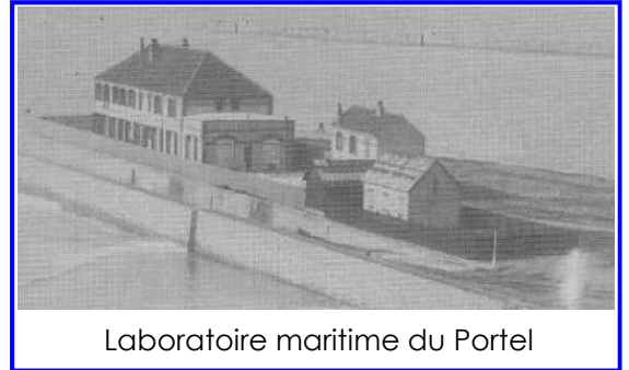
Laboratoire maritime du Portel