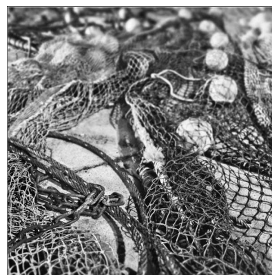
Filets de pêche