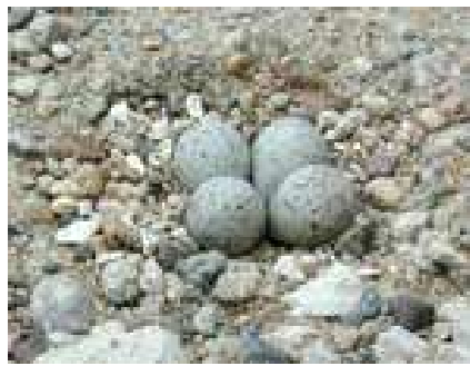
Œufs et pontes