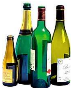
Bouteilles en verre