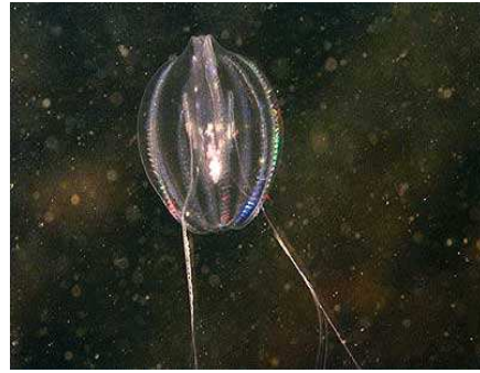
Groseille de mer