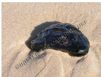
Galettes de goudron