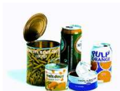
Boîtes de conserve