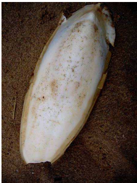
Os de seiche